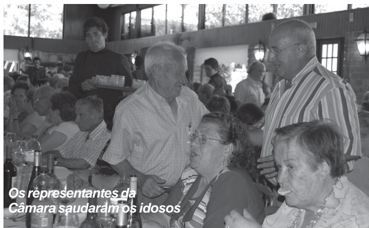
Os representantes da Câmara saudaram os idosos