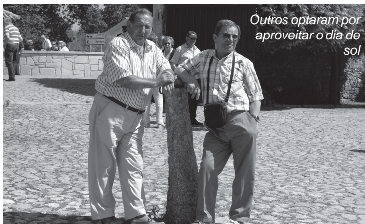
Outros optaram por aproveitar o dia de sol