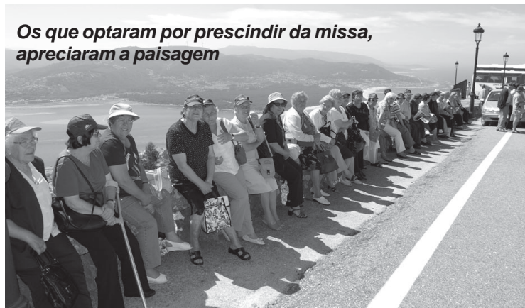
Os que optaram por prescindir da missa, apreciaram a paisagem