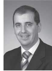
Por João Paulo Santos*

O Centro Recreativo de Mafamude (CRM), no passado Sábado, realizou, mais uma vez, o seu Sarau Cultural e Desportivo anual, pela terceira vez consecutiva, no Coliseu do Porto. Por cerca de 400 praticantes, das diversas actividades que existem no CRM, que passaram pelo palco, foi proporcionado a milhares de espectadores, que encheram a magnífica sala do Porto, uma noite de espectáculo, de cor, de luz e de fantasia.