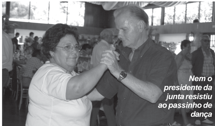
Nem o presidente da junta resistiu ao passinho de dança